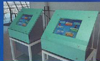
五稜郭導覽(電腦檢索系統)