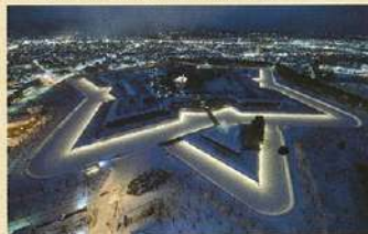
五稜星之夢彩燈(12月~2月)