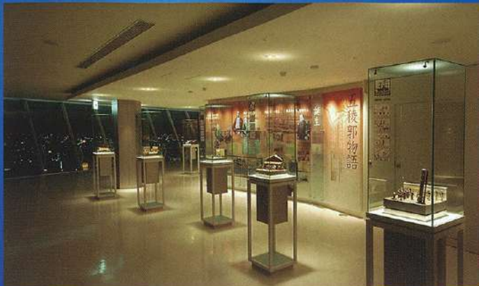
紀念模型箱 | 照片展示