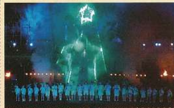
市民創作函館野外劇(7月~8月)