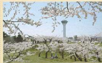
櫻花名勝地,五稜郭公園