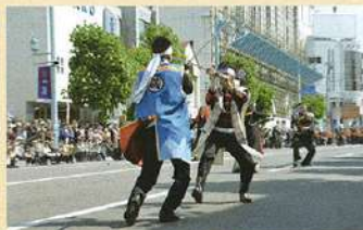
箱館五稜郭祭(5月第3個週六、日)