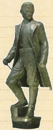
「佇立於五稜郭上的土方歲三」 (銅像 小寺真知子製作)

五稜郭的春天伴隨櫻花同時到來。 從大正時代栽植的 約1,600株染井吉野等櫻花一同綻放。 初夏則有「箱館五稜郭祭」。 維新隊伍以培利航來後的 五稜郭歷史為主題在街上遊行。 然後「市民創作函館野外劇」 在盛夏的夜晚裏將函館的歷史重現。 五稜郭的護城河和石牆是壯觀的舞台。 「五稜星之夢」則是在星形的護城河周圍 裝飾了2,000個燈泡點綴。 現在的五稜郭是市民文化的發射基地。