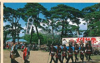
箱館五稜郭祭 (5月第3個週六、日)