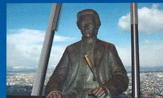
土方歲三像(銅座像) 小寺真知子製作