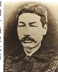
武田斐三郎 (1827~1880) 入籍方洪庵塾門下，學習洋學諸術，培利艦隊前來浦賀時正在久間象山門下學習。他身為西洋軍事專家，於製鐵、造船、大炮、築城等方面甚為出名，並在箱館開港後，以箱館諸術調所的教授身份大為活躍。之後被幕府任命為弁天台場、五稜郭的設計總監。

「五稜郭誕生」五稜郭誕生的由來，是在嘉永6年(1853)美國艦隊來航，也就是所謂「黑船來航」的大事件。屈服於開國要求的德川幕府於安政元年(1854)締結日美和親條約，將箱館(到明治以前，函館標記為「箱館」)設為開港場。為了治理箱館，幕府設置了「箱館奉行」，目的在於培植產業和促進開拓，同時為了強化箱館的防備，還命令蘭學學者武田斐三郎，隨著奉行所廳舍的遷移設計新要塞。武田斐三郎在「箱館諸術調所」擔任西歐學問和技術研究的教授一職，也是個出色的教育者。他以歐洲的「城堡都市」為藍本設計了此一要塞，花了約七年時間興建，五稜郭成了蝦夷地方之要衝，也是此地政治、外交、軍事的據點。