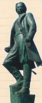
「佇立於五稜郭上的土方歲三」 (銅像 小寺真知子製作)

五稜郭的春天伴隨櫻花同時到來。 從大正時代栽植的 約1,600株染井吉野等櫻花一同綻放。 初夏則有「箱館五稜郭祭」。 維新隊伍以培利航來後的 五稜郭歷史為主題在街上遊行。 然後「市民創作函館野外劇」 在盛夏的夜晚裏將函館的歷史重現。 五稜郭的護城河和石牆是壯觀的舞台。 「五稜星之夢」則是在星形的護城河周圍 裝飾了2,000個燈泡點綴。 現在的五稜郭是市民文化的發射基地。