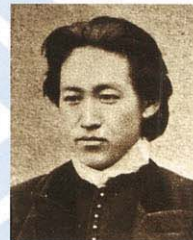
土方歲三 (1835~1869) 一邊行走實業，一邊來往道場，此時與近藤勇、沖田總司們相遇。因此得到進京的機會，參加了維持京都治安的「新選組」。土方身為副長以嚴格馳名，後來與榎本軍會合，在箱館戰爭中戰死。

象徵新時代而誕生的五稜郭雖然成了封建制度的終結地，但是五稜郭的歷史並非到此結束。之後，大正3年(1914)年時修整成公園，開放為市民休憩的空間，於昭和27年(1952)被指定為特別史蹟，做為歷史的傳述者靜候人們的造訪。