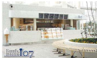
1樓 食物 & 飲料 107