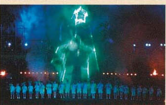
市民創作函館野外劇 (7月~8月)