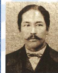
榎本武揚 (1836~1908) 荷蘭留學後，被任命為幕府的海軍副總裁。明治維新後，因拒絕將軍權移交給新政府而脫逃。在箱館依靠舊幕府建立偽政權，但在箱館戰爭中失敗投降。後來於明治政府中擔任要職。

戊辰戰爭起因於對幕府屈服於美國的要求感到不滿，而發展至倒幕運動，並因此將日本一分为二。幕府在大政奉還，交出江戶城等之後，勢力已如風中殘燭，在這當中，舊幕府海軍副總裁榎本武揚收容了陸軍諸隊，率領艦隊開往蝦夷地區占領五稜郭。他們於明治元年(1868)12月樹立偽政權，雖然以德川家臣的身分向政府要求蝦夷地的開拓許可，但隔年明治2年(1869)春天，政府派遣軍隊開始攻擊舊幕府逃兵，箱館戰爭由此爆發。土方歲三等在面臨新政府壓倒性的戰力攻擊下進行空虛的抵抗，最終五稜郭仍被圍剿，舊幕府軍投降。幕府末期動亂就此結束。