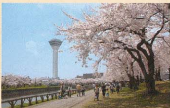
櫻花名勝地・五稜郭公園