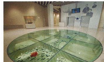
地板展示「箱館之光」