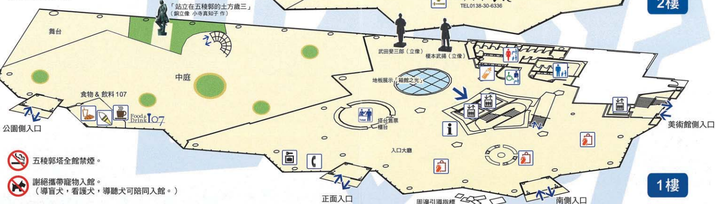
五稜郭塔全館禁煙。

全天候型的玻璃廣場，有擺設植物盆栽。逛累了五稜郭的話，歡迎來這裡充滿溫暖陽光和鮮綠植物的空間——休息片刻。請享受悠閒的時光。