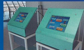
五稜郭導覽(電腦檢索系統)