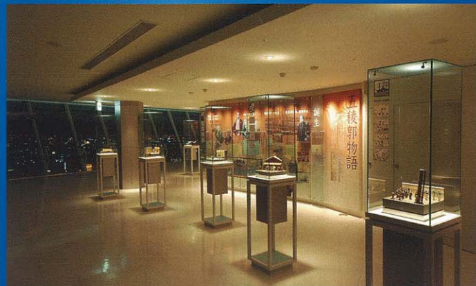
紀念模型箱 | 照片展示