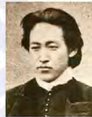
土方歲三(1835~1869) 一邊行走賣藥，一邊往道場，此時與近藤勇、沖田總司們相遇，因此得到進京的機會，參加了維持京都治安的「新撰組」。土方身為副團長以嚴格馳名，後來與榎本軍會合，在箱館戰爭中戰死。

「幕府末年的動亂—箱館戰爭」 戊辰戰爭起因於對幕府屈服於美國的要求感到不滿，而發展至倒幕運動，並因此將日本一分为二。幕府在大政奉還，交出江戶城等之後，勢力已如風中殘燭，在這當中，舊幕府海軍副總裁榎本武揚收容了陸軍諸隊，率領艦隊開往蝦夷地區領五稜郭。他們於明治元年(1868)12月樹立偽政權，雖然以德川家臣的身分向政府要求蝦夷地的開拓許可，但隔年明治2年(1869)春天，政府派遣軍隊開始攻擊舊幕府逃兵，箱館戰爭由此爆發。土方歲三等在面臨新政府壓倒性的戰力攻擊下進行空虛的抵抗，最終五稜郭仍被圍剿，舊幕府軍投降。幕府末期動亂就此結束。