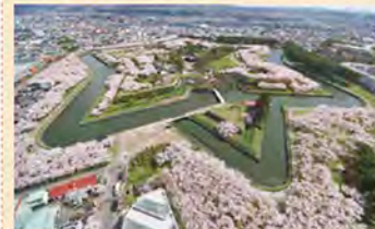
櫻花名勝地・五稜郭公園