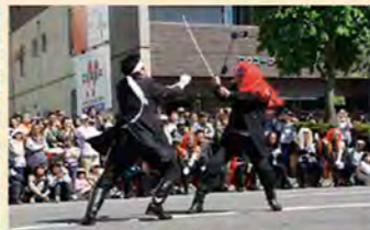
箱館五稜郭祭 (5月第3個週六、日)