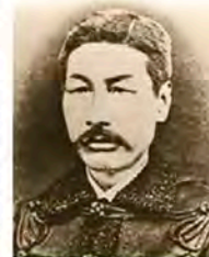
武田斐三郎(1827~1880) 德方洪庵塾門下學習西洋諸術。佩里艦隊在浦賀來航之際，正師從從久間象山學習。作為西洋軍事學者熟知制鐵、造船、大炮、建城等，箱館開港後活躍於箱館諸術調所的教育工作。之後接受幕府的命書，成為了并天台、五稜郭的設計監督。

「五稜郭誕生」五稜郭誕生的由來，是在嘉永6年(1853)美國艦隊來船，也就是所謂「黑船來航」的大事件。屈服於開國要求的德川幕府於安政元年(1854)締結日美和親條約，將箱館(到明治以前，函館標記為「箱館」)設為開港場。為了治理箱館，幕府設置了「箱館奉行」，目的在於培植產業和促進開拓，同時為了強化箱館的防備，還命令蘭學學者武田斐三郎，隨著奉行所廳舍的遷移設計新要塞。武田斐三郎在「箱館諸術調所」擔任西歐學問和技術研究的教授一職，也是個出色的教育者。他以歐洲的「城堡都市」為藍本設計了此一要塞，花了約七年時間興建，五稜郭成了蝦夷地方之要衝，也是此地政治、外交、軍事的據點。