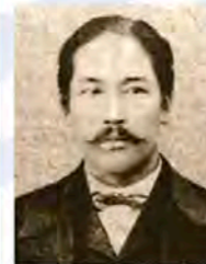
榎本武揚(1836~1908) 荷蘭留學後，被任命為幕府的海軍副總裁。明治維新後，因拒絕將軍職移交給新政府而脫逃。在箱館依靠舊幕府建立偽政權，但在箱館戰爭中失敗投降。後來於明治政府中擔任要職。

「幕府末年的動亂—箱館戰爭」 戊辰戰爭起因於對幕府屈服於美國的要求感到不滿，而發展至倒幕運動，並因此將日本一分为二。幕府在大政奉還，交出江戶城等之後，勢力已如風中殘燭，在這當中，舊幕府海軍副總裁榎本武揚收容了陸軍諸隊，率領艦隊開往蝦夷地區領五稜郭。他們於明治元年(1868)12月樹立偽政權，雖然以德川家臣的身分向政府要求蝦夷地的開拓許可，但隔年明治2年(1869)春天，政府派遣軍隊開始攻擊舊幕府逃兵，箱館戰爭由此爆發。土方歲三等在面臨新政府壓倒性的戰力攻擊下進行空虛的抵抗，最終五稜郭仍被圍剿，舊幕府軍投降。幕府末期動亂就此結束。