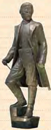
「佇立於五稜郭上的土方歲三」 (銅像 小寺真知子製作)

五稜郭春天伴隨著櫻花一同到來。 約1,500棵大正時代種植的染井吉野櫻一齊綻放。 初夏時會舉辦「箱館五稜郭祭」。 培里來日開啟了五稜郭歷史， 以該歷史為主題的維新志士隊伍會在街上遊行。 秋季到冬季期間的五稜郭， 腹地內樹葉盡凋， 呈現出清楚俐落的星形線條。 越發顯現其身為特別史蹟文化財產的份量。 12月起會舉辦「五稜星之夢」活動。 約有2,000個燈飾點綴在星形護城河邊。 五稜郭已然成為傳遞市民文化的中心。